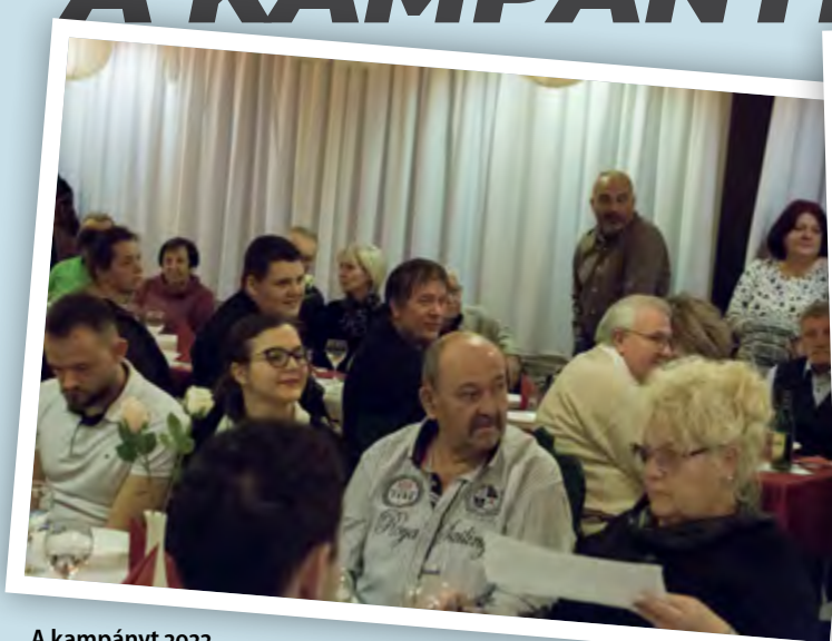
A kampányt 2022 januárjában indítottuk a Bogrács étteremben tartott aktivista összejövetellel