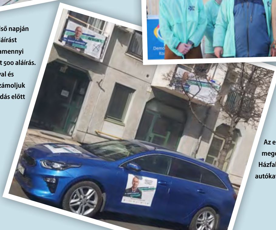
Az ellenfél hatalmas anyagi fölényét alternatív megoldásokkal igyekeztünk ellensúlyozni. Házfalakon és erkélyeken helyeztünk el molinókat, autókat dekoráltunk autómágnesekkel.