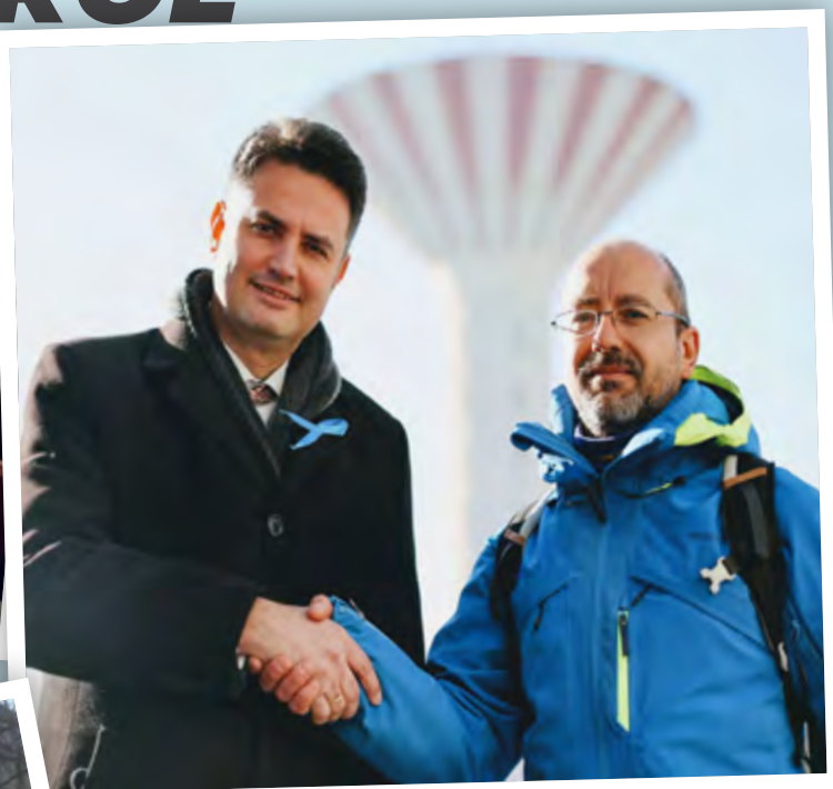
Az aláírásgyűjtés előtt két nappal vendégünk volt Márki-Zay Péter, az Egységben Magyarország miniszterelnök-jelölje