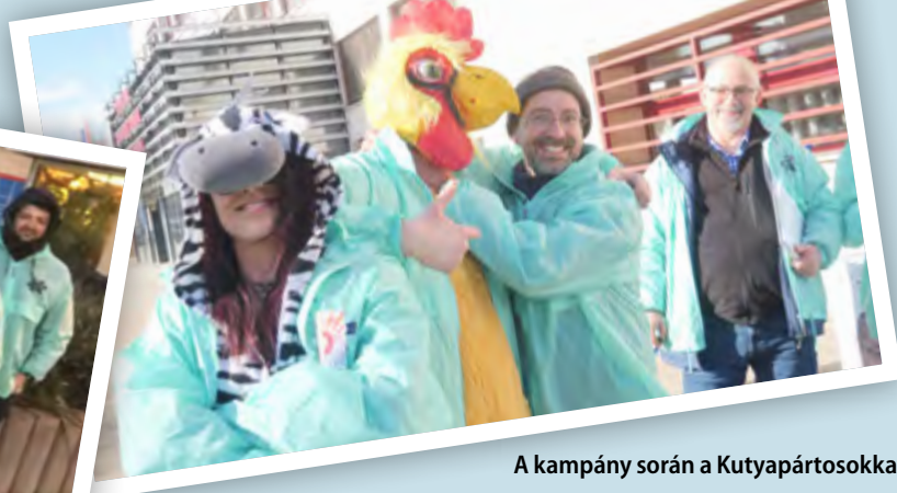
A kampány során a Kutypártosokkal barátkoztunk össze a leginkább a vetélytársak közül. A csirke és a zebra is nagy kedvencünké vált