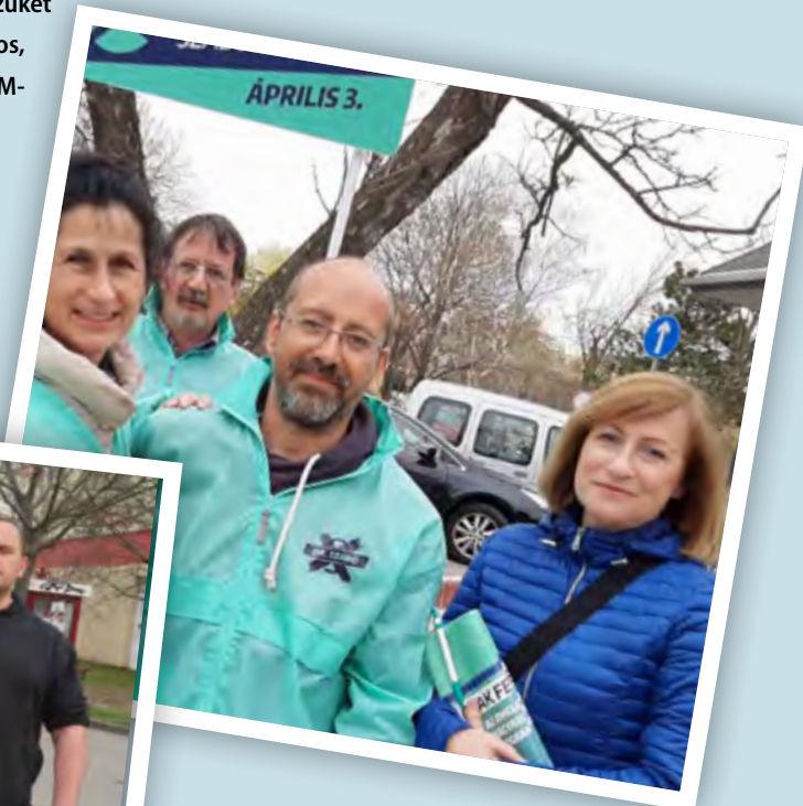
A Csikó sétány sem maradhatott kampány nélkül