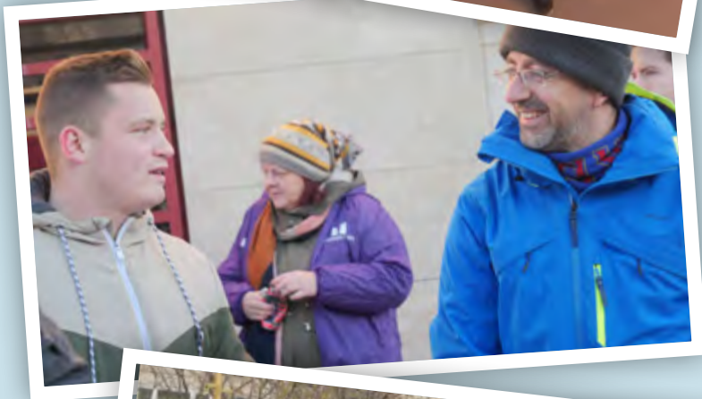
A közösen végzett munkából kivették a részüket a Momentumos, Jobbikos, MMM-es fiatalok is